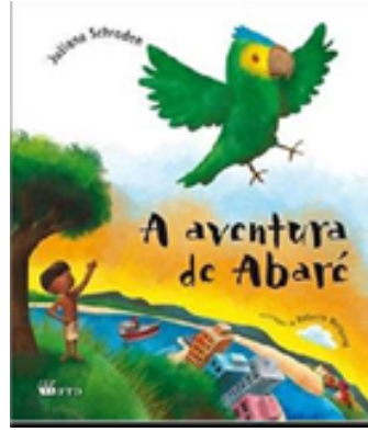
AS AVENTURAS DE ABARÉ