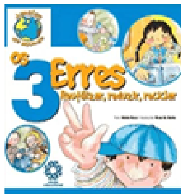
OS 3 ERRES

REUTILIZAR, REDUZIR, RECICLAR AUTORA: NÚRIA ROCA EDITORA ESCOLA EDUCACIONAL