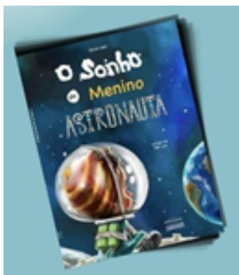
O SONHO DO MENINO ASTRONAUTA